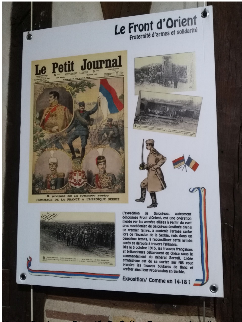
Франс Саваше и Зарже Србије у Првом светском рату. допунске српске школе, биће приказан