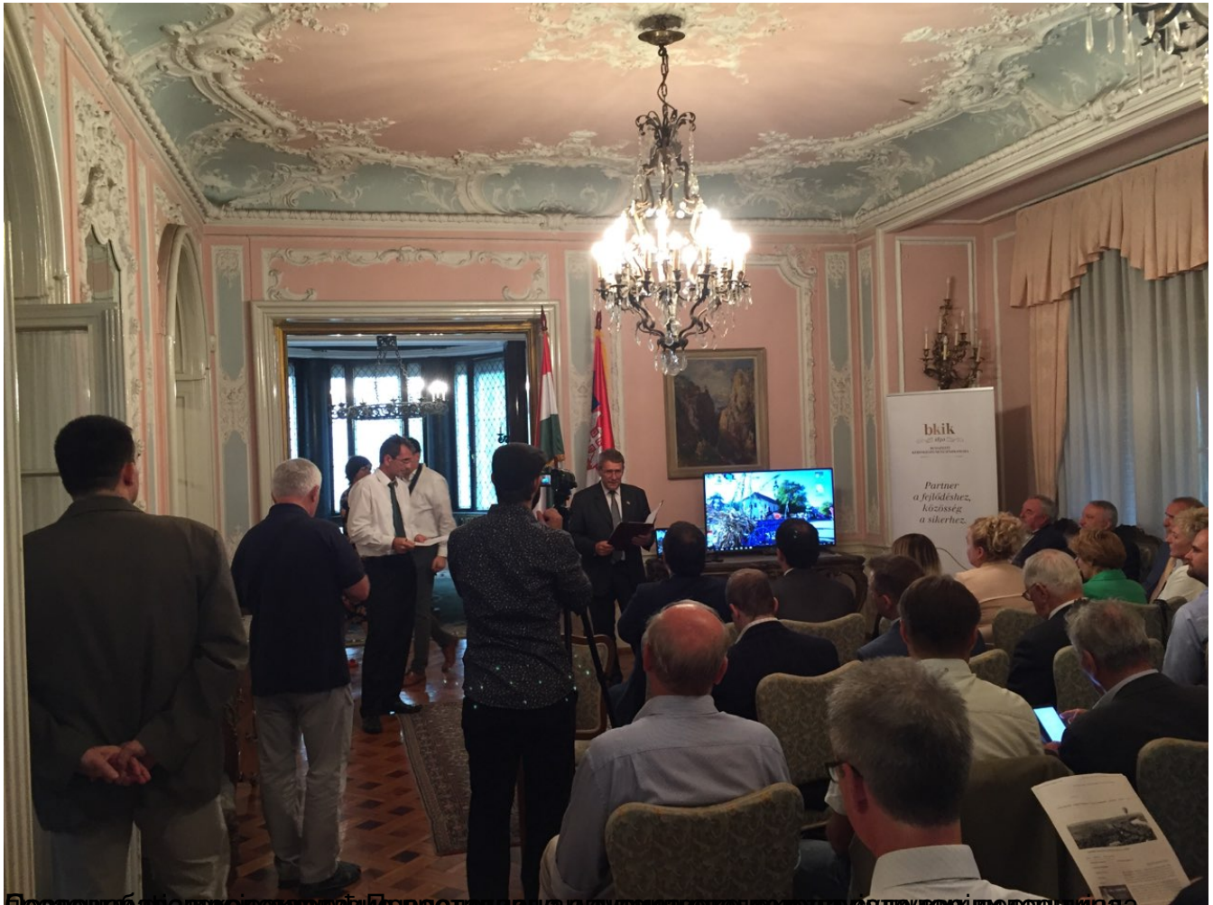
Босански бизнис форум у Будимпешти, 10. јуна 2018. године.